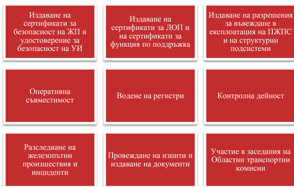
Фигура 5 Дейности на Главна дирекция "Железопътна инспекция" за 2017 г.

Основните направления на дейността на Главна дирекция „Железопътна инспекция“ са показани на фигура 5 .