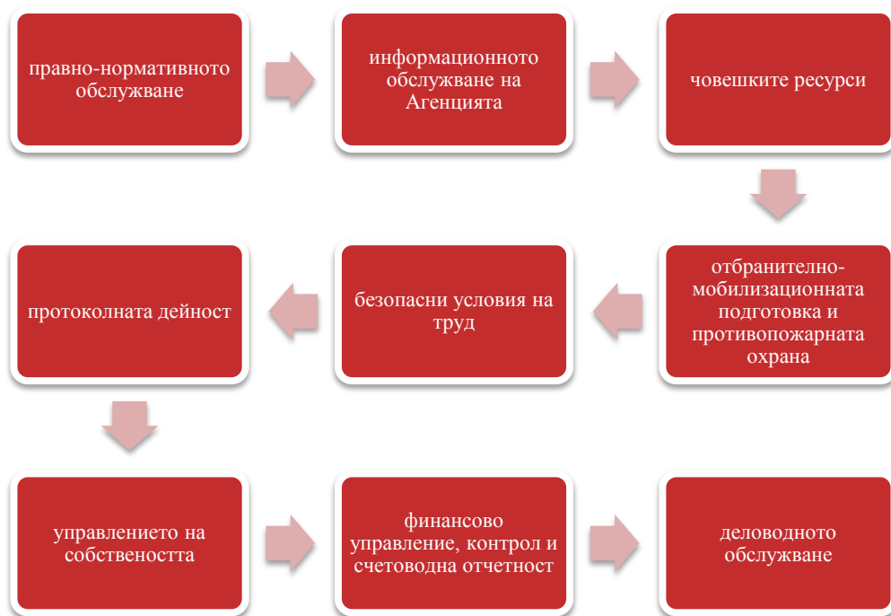
фигура 3 Дейности на дирекция АПФСО

Дирекция „Административно - правно и финансово-стопанско обслужване“ (АПФСО) изпълнява функции по техническото осигуряване на дейността на изпълнителния директор, на специализираната администрация и на териториалните звена към специализираната администрация и те са описани на фигура 3 .