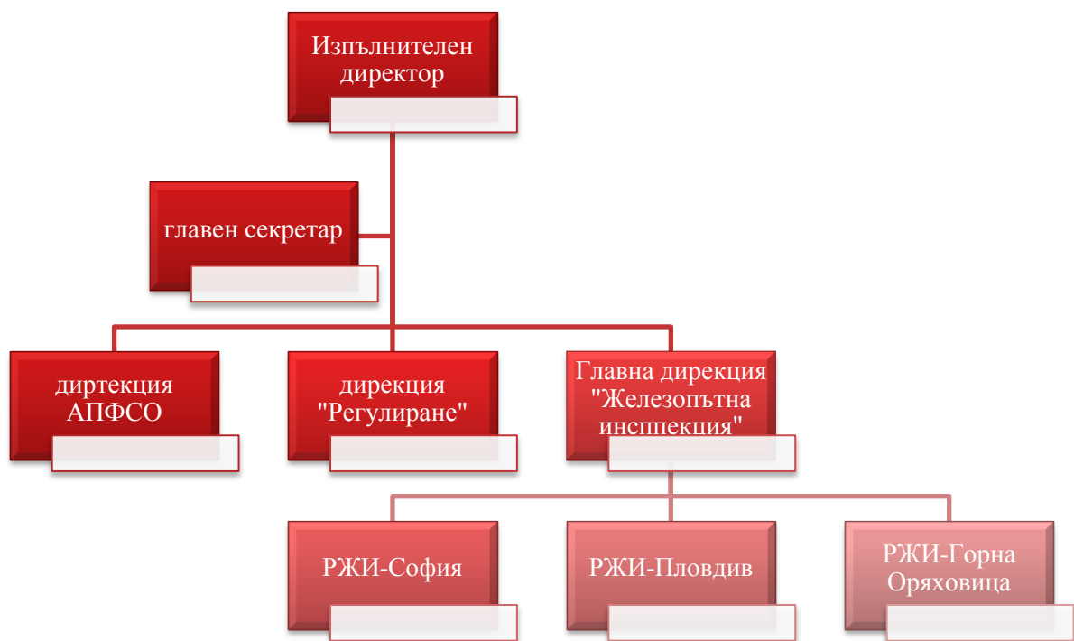
Фигура 1 Организационна структура на ИАЖА

Дейността на агенцията се извършва от обща и специализирана администрация, организирана в дирекции, както е показано на фигура 1 , която подпомага изпълнителния директор при осъществяване на правомощията му и осигурява техническата дейност и административното обслужване на физически и юридически лица.