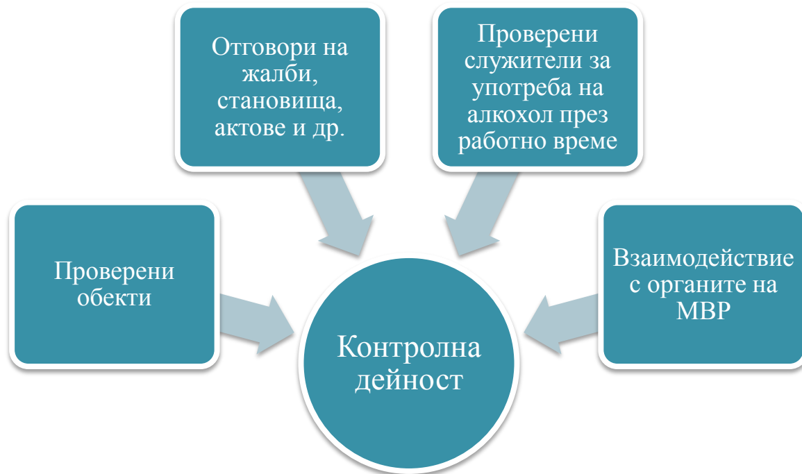
Фигура 6 Контролна дейност на ГДЖИ

Контролната дейност на Главна дирекция „Железопътна инспекция“ е показана на фигура 6 . Направленията са следните: проверка на обекти, отговор на жалби, становища актове и др., проверка на служители в железопътния транспорт за употреба на алкохол, както и взаимодействие с органите на Министерството на вътрешните работи.