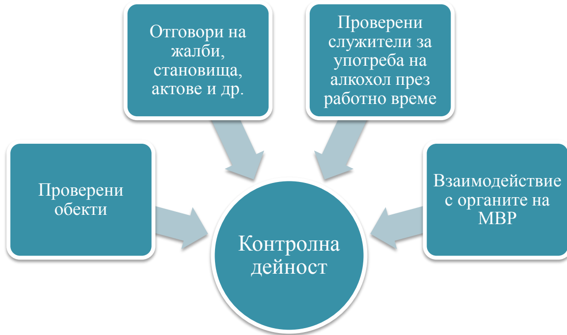
Фигура 5 Контролна дейност на ГДЖИ

Контролната дейност на Главна дирекция „Железопътна инспекция“ е в четири насоки, които схематично са изобразени на фигура 5 . Направленията са следните: проверка на обекти, отговор на жалби, становища актове и др., проверка на служители в железопътния транспорт за употреба на алкохол през работно време, както и взаимодействие с органите на Министерството на вътрешните работи.