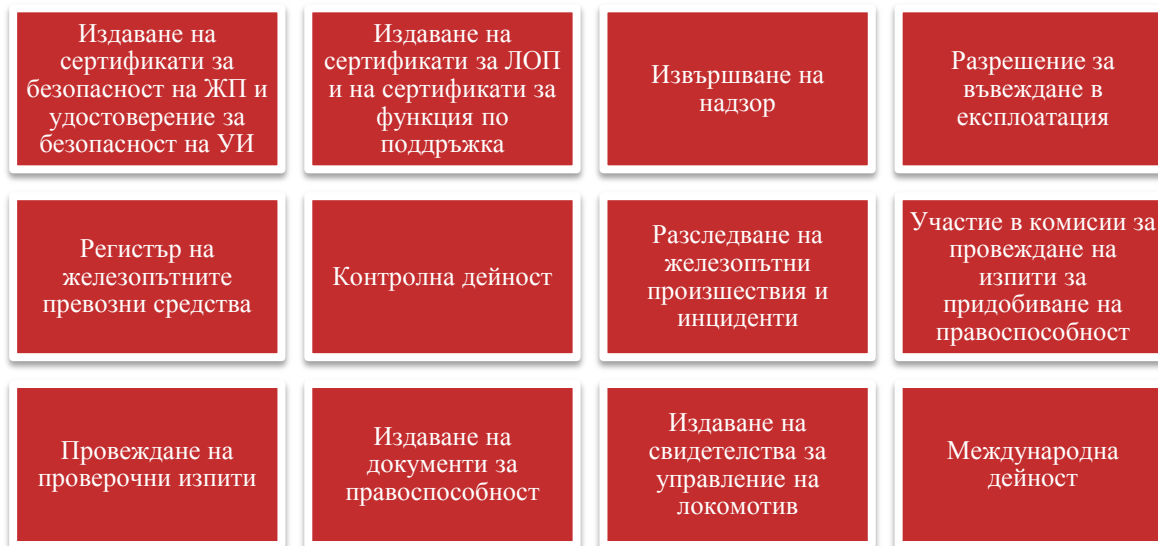
Фигура 4 Дейности на Главна дирекция "Железопътна инспекция" за 2016 г.

Основните направления от дейността на Главна дирекция „Железопътна инспекция“ са показани на фигура 4 . От нея става ясно, че дирекцията е насочила дейността си в дванадесет основни направления.