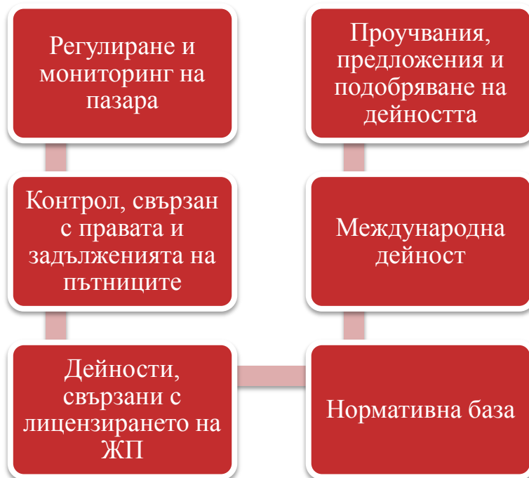
Фигура 3 Дейности на дирекция "Регулиране" през 2016 г.

Подробно описание на всяка една от дейностите на дирекция „Регулиране“ е изложено в точките по-долу в настоящия доклад.